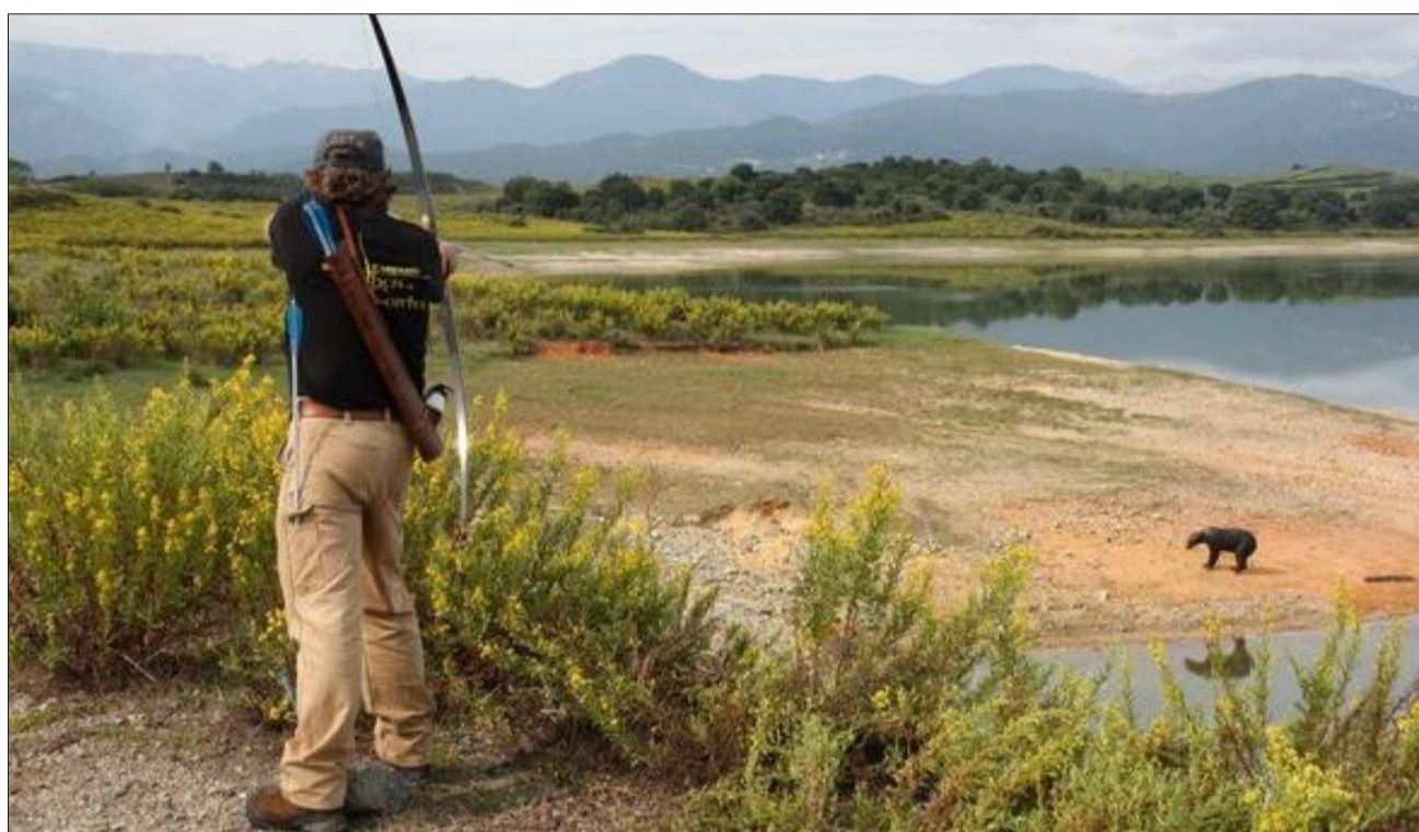
Une fois arrivé à son poste de tir, l'archer a une minute et trente secondes pour découvrir la cible et tirer ses deux flèches. Les cibles, en mousse, sont placées de 5 à 45 m. À La Féclaz, les parcours seront situés en haut du télésiège de l'Orionde, à La Féclaz, ou au pied de la piste noire.

Une fois arrivé à son poste de tir, l'archer a une minute et trente secondes pour découvrir la cible, évaluer la distance, repérer le point névralgique de l'animal, souvent à la jumelle, et tirer ses deux flèches. Les parties vitales de