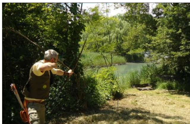
Les cibles en mousse, en trois dimensions, représentent des animaux de taille réelle. Les parties vitales de l'animal sont matérialisées par des zones qui donnent des points en fonction de l'impact des flèches.

Voici le déroulement du championnat de France.